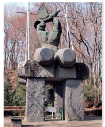
自由民権の像 1998 三橋国民作 薬師池公園

町田市の非核都市宣言から40年、現下の政治状況は混沌のなかで大きく右旋回、この時に我々が立ち上がらねば、の強い思いで活動を始めました。府中のみなさんのようにニュースレターを発行する力を養いたい思いですが、さしあたっては広報ビラ（フライヤー）の発行を企画中です。9条の碑・府中の経験に学び、ご助言もいただければと願っています。