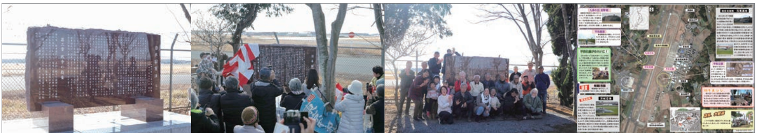
百里・憲法9条の碑

「府中」での「9条の碑」の一日でも早い完成を願っています。「われらは、全世界の国民が、ひとしく恐怖と欠乏から免れ、平和のうちに生存する権利を有することを確認する」ために、共に歩いていきましょう。