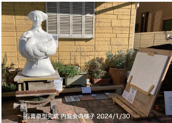
石膏原型完成 内覧会の様子 2024/1/30